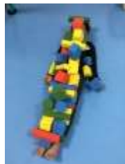
動けない... でも心地良い～