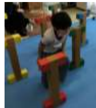
棒に当たってはいけないよ!