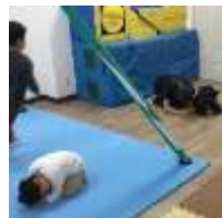
新・たこやき 鬼ごっこ